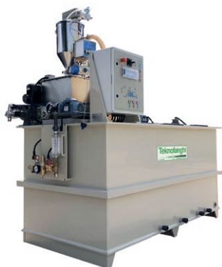
CAP (Série polipropileno)